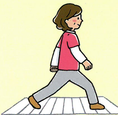
2ステップテスト (歩幅を調べる)